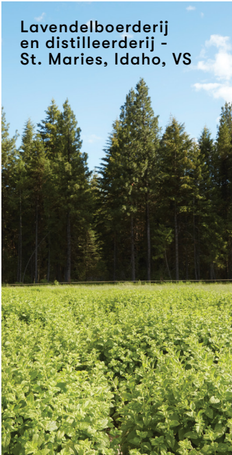
Lavendelboerderij en distilleerderij - St. Maries, Idaho, VS