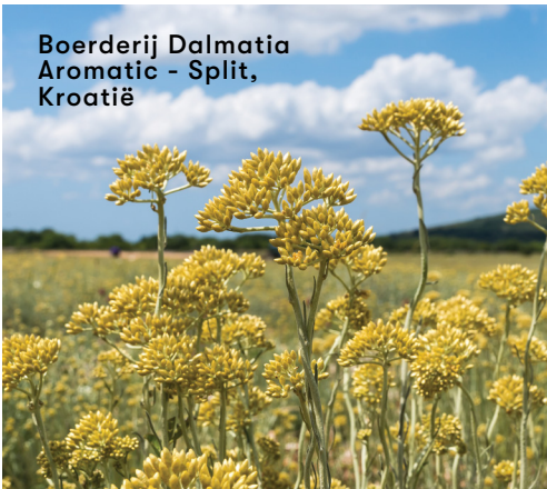
Boerderij Dalmatia Aromatic - Split, Kroatië