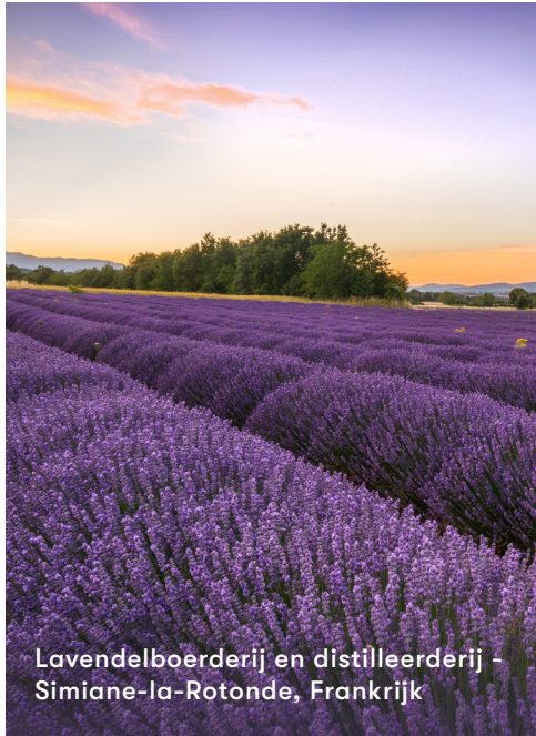
Lavendelboerderij en distilleerderij - Simiane-la-Rotonde, Frankrijk