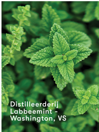
Distilleerderij Labbeemint - Washington, VS