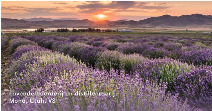
Lavendelboerderij en distilleerderij - Mona, Utah, VS